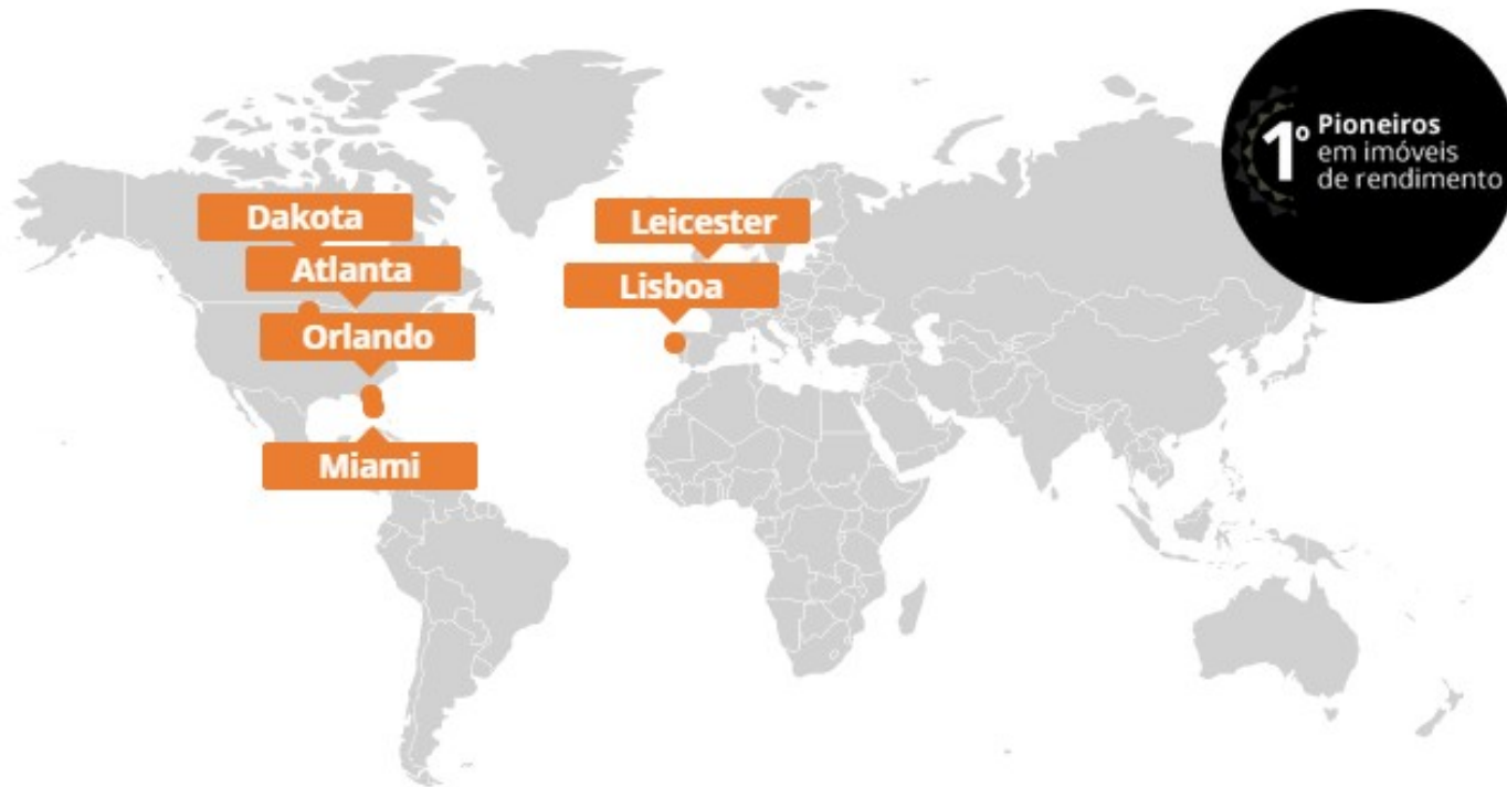
Mapa de Investimentos Globais Ativore

Nem sempre os imóveis com maior rendimento líquido de aluguel estão localizados na cidade ou país de residência do investidor. A diversificação internacional protege o investidor imobiliário contra os choques das economias domésticas e diminui o impacto das variações cambiais sobre sua carteira imobiliária.