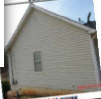
SIDE OF HOUSE