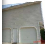
SIDE OF HOUSE